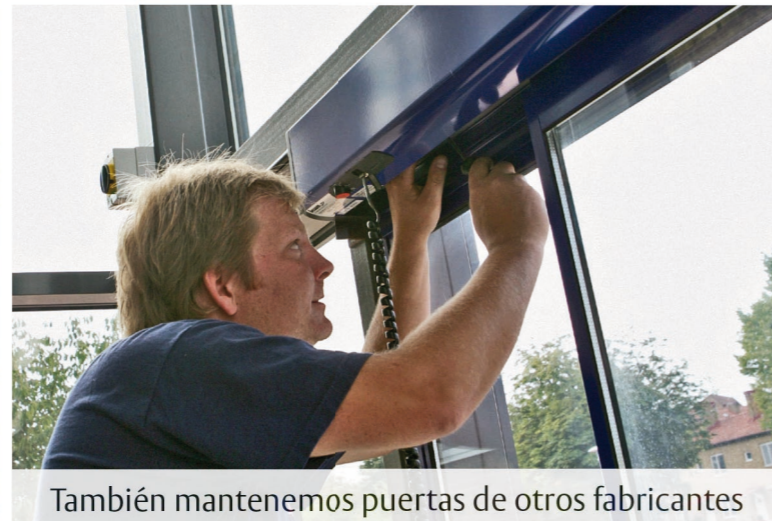
También mantenemos puertas de otros fabricantes

Puertas correderas • Puertas batientes • Puertas giratorias • Puertas industriales • Servicio