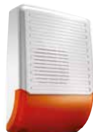
Sirena para exterior con destello LED