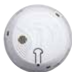
Detector de humos