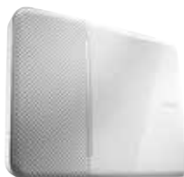
Sirena de interior