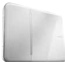
Unidad central / Transmisor GSM