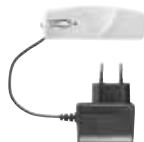
Detector de corte de corriente