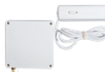
Detector de apertura de persiana enrollable