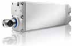
Pergola Tilt 24V WT Operador de pistón 24V 150mm para pérgola con lamas orientables.