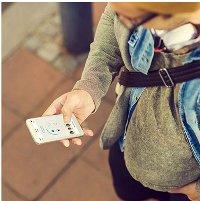
App para la gestión de Somfy ONE

Desactivación automática de la alarma , Somfy ONE además de gestionarse desde la App, incluye como accesorio un llavero inteligente que desactiva la alarma en modo de manos libres, es decir, cuando el usuario llega a casa. Así, los niños, por ejemplo, pueden llevar este llavero encima y no tendrán que preocuparse de desconectar el sistema para acceder al hogar. De esto modo, se evitan las falsas alarmas.