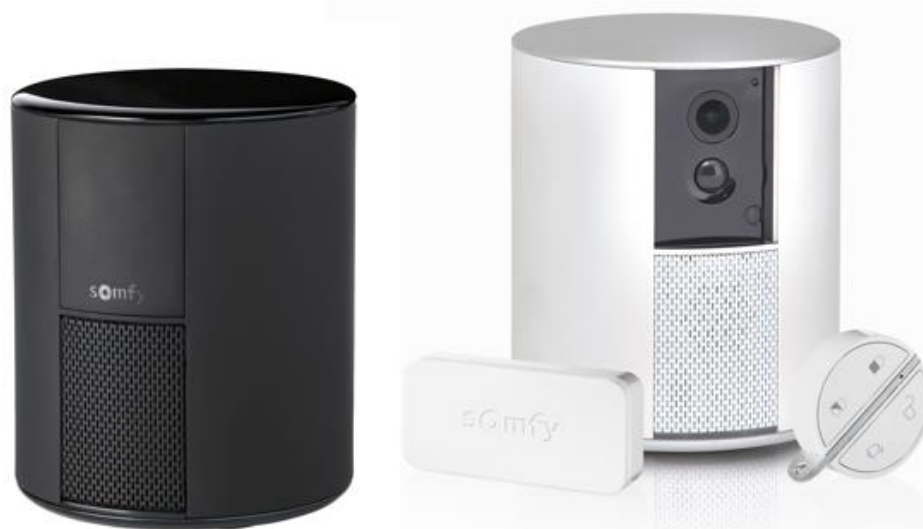
En la imagen, Somfy One (en negro) Y Somfy One+ (en blanco)

La manera más sencilla de vigilar tu hogar para que esté más seguro.