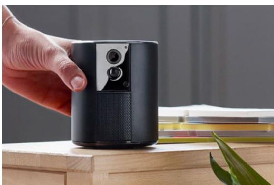
Somfy ONE fácil de instalar

Sencilla instalación Uno de los objetivos en la creación de Somfy ONE era simplificar su instalación y su uso diario. Por este motivo se instala en muy pocos minutos desde el smartphone, sin necesidad de herramientas adicionales. En el día a día, se gestiona con gran facilidad, por ejemplo, mediante la Activación Automática, que permite activar y desactivar automáticamente la protección gracias a la geolocalización del teléfono.