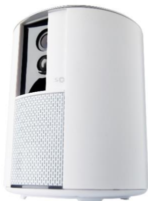
Somfy ONE + cerrando la tapa de la cámara

Respeto a la privacidad de los usuarios queda garantizado gracias al obturador motorizado, que cubre automáticamente el objetivo y el micrófono de la cámara una vez que los miembros de la familia han entrado al hogar. De esta manera se preserva totalmente su intimidad.